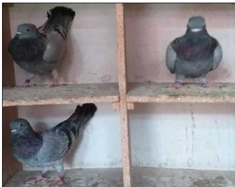
Boško Šibenik-Pobjedniko jato CTU Let Grada Vukovara - 9,58