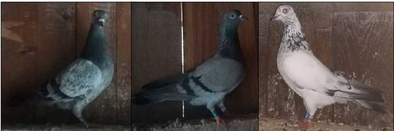
Oliver Puri –Pobjedni ko jato CTU Najduži dan 2021. rezultat 13,55