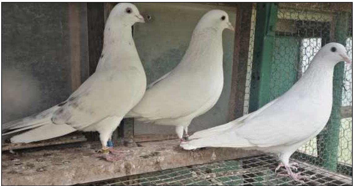
Ivica Brdari -Pobjedni ko jato CTU –Kup Hrvatske 2021. rezultat 19,47