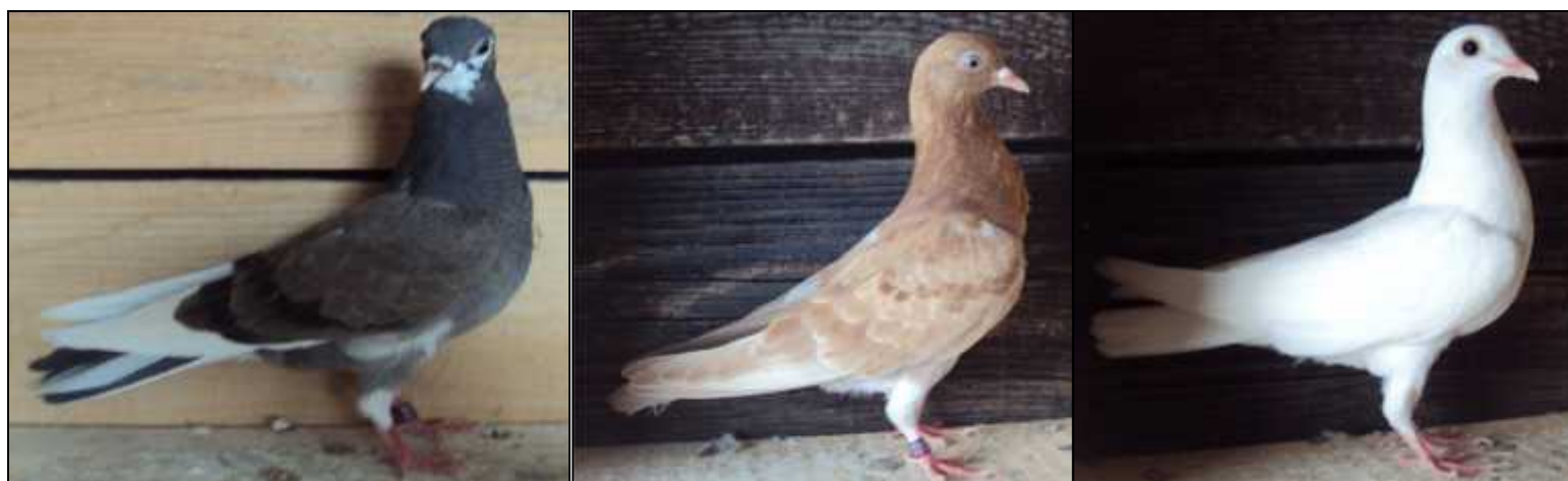
Ivica Konjarević -Pobjedniko jato CTU Meunarodno mladi 12,50