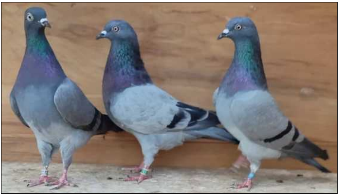
Pero Tenžera – Pobjedni ko jato CTU -Seniori 2021. rezultat 18,45